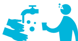
手洗い・うがい・殺菌の徹底