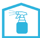
消毒用アルコールの設置 室内の除菌を徹底